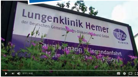
Lungenklinik Hemer – Zentrum für Pneumologie und Thoraxchirurgie